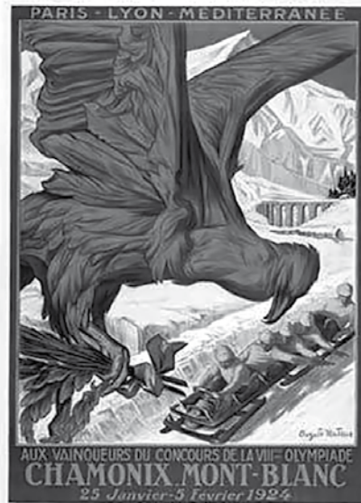
Affiche de Chamonix 1924 jeux Olympiques d'hiver, produite à 5000 exemplaires. (25 janvier - 5 février 1924)