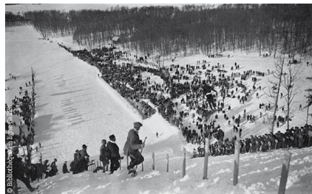
Le tremplin olympique du Mont-Blanc - Chamonix 1924.