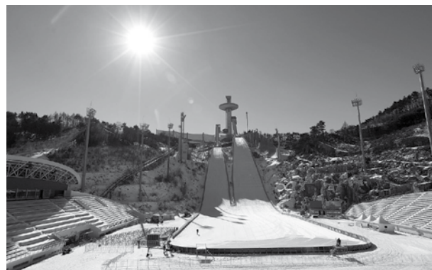
Alpensia Ski Jumping Stadium - PyeongChang 2018.