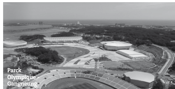
Parc Olympique Gangneung