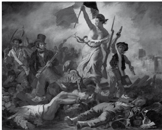
Peinture historique romantique. Commémore les Trois Glorieuses (la Révolution de Juillet) le 28 juillet 1830

Ferdinand Victor Eugène Delacroix naît à Saint Maurice (Val de Marne) en 1798 au moment où le Directoire, de coup d'état en coup d'état, chancelle. Napoléon Bonaparte, revenu d'Égypte, va le renverser par celui du 18 brumaire et prendre la direction de la France pour quinze ans ! La Révolution est bien finie, mais la stabilité n'est pas toujours au rendez-vous : Delacroix connaît le premier Empire, la restauration monarchique avec Louis XVIII, Charles X et Louis Philippe, la deuxième République et le second Empire, avec à la clé deux révolutions, celles de 1830 et de 1848 ! Ces turbulences de l'Histoire ont eu un impact sur son œuvre qui incarne, avec celle de Géricault, le « Romantisme », opposé au néo-classicisme dont Ingres était le champion.