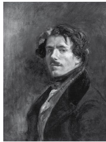
Autoportrait au gilet vert Huile 65 cm x 54,5 cm - Musée du Louvre

Comme Théodore Géricault, il fut élève de David, un classique s'il en fut, mais il rompt avec ce style en allant au Louvre copier Rubens et Véronèse. Il expose pour la première fois au Salon de 1822 avec « Dante et Virgile aux enfers »* puis très régulièrement. Lors d'un voyage en Angleterre, il découvre le théâtre de Shakespeare qui va inspirer une partie de son œuvre. En 1828 il déchaîne les foudres de la critique avec sa « Mort de Sardanapale »* : on y voit le roi assyrien, étendu