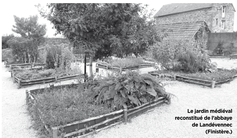
Le jardin médiéval reconstitué de l'abbaye de Landévennec (Finistère.)