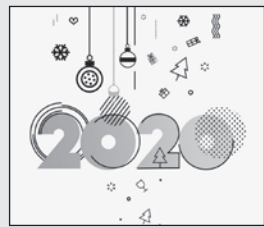
• Les vœux des Échos de Meulan