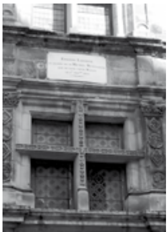
Maison natale d'Étienne de La Boétie

Nous sommes passés par le marché couvert logé dans l'ancienne église médiévale Sainte-Marie dont les deux immenses portes métalliques s'ouvrent les jours de marché. L'architecte Jean Nouvel a créé un ascenseur en verre qui nous a permis de monter au sommet du clocher pour découvrir un point de vue à 360° sur la cité.